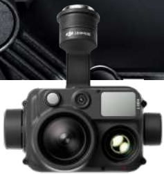
ZENMUSE H30 SERIES

Los cuatro puertos externos E-Port V2 de Matrice 400 permiten montar hasta siete instrumentos al mismo tiempo , con una capacidad de carga máxima de 6 kg . Admite el cambio libre entre uno y dos estabilizadores inferiores, y también cuenta con un tercer conector como estabilizador. Los instrumentos de DJI y de terceros son compatibles, entre ellos, las series Zenmuse H30, L2, P1, S1, V1 y Manifold 3.